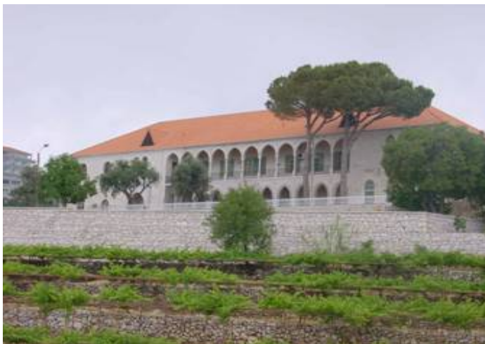
Couvent Saint Jean. Complètement rénové en 2003