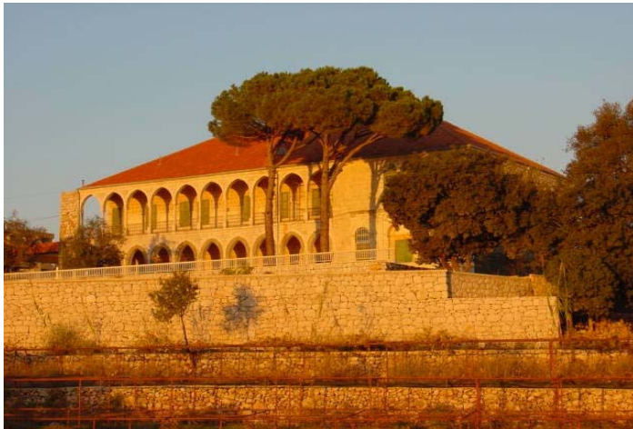
Couvent Saint Jean. Tel qu'il fut érigé en 1897

La nouvelle école fit ses préparatifs et procéda à l'inscription des élèves, et les cours débutèrent en octobre 2000 à l'Antonine International School au couvent Saint-Jean – Ajaltoun, accueillant des élèves de la maternelle jusqu'à la troisième année de l'éducation de base selon deux programmes: Arabe – Anglais, et Arabe – Français. Et grâce à la gestion pédagogique évoluée, au corps professoral spécialisé et aux équipements techniques et pédagogiques modernes, l'école prospéra, accueillant au cours de l'année scolaire 2003/2004 cinq cents élèves, progressant jusqu'à la 6ème année de l'enseignement de base et aspirant d'atteindre progressivement les classes terminales.